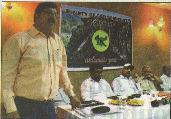
General secretary of the Society of Geo-Scientists of Jharkhand addresses the 4th annual meeting in Ranchi on Sunday.