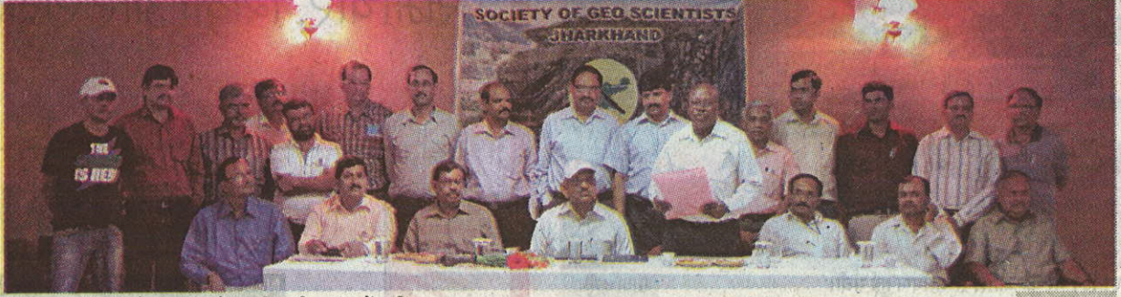
सोसायटी ऑफ जियो साइंटिस्ट के पदाधिकारी व मंच में उपस्थित सदस्य।